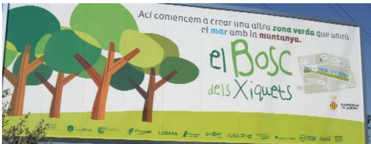
Los niños han intervenido en la plantación y cuidado de árboles en la propuesta galardonada del Ayuntamiento de Sagunto.