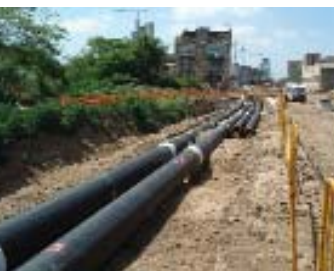
Central de producción y proceso de instalación de las tuberías de distribución de aire frío y caliente en Barcelona.