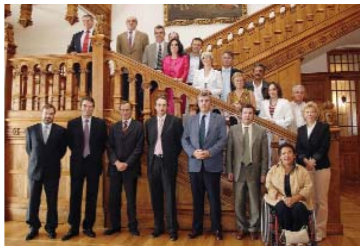
Los participantes de la Comisión Ejecutiva de la Red Española de Ciudades por el Clima, tras la reunión celebrada en el Palacio de La Magdalena, en Santander.

La entrega de los Premios tendrá lugar en Gijón el día 3 de octubre, en el transcurso de la II Asamblea de Ciudades de la Red Española de Ciudades por el Clima.