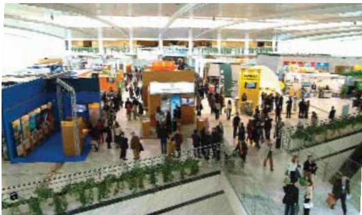
Panorámica de la anterior edición del Congreso Nacional de Medio Ambiente, CONAMA.

El debate sobre la sostenibilidad implica al conjunto de la sociedad, porque toda la sociedad es sujeto pasivo y activo de las acciones y consecuencias del modelo de desarrollo, e implica también a los poderes públicos que tienen la responsabilidad de adoptar las medidas adecuadas para conciliar el desarrollo con la preservación de los recursos del planeta. Sobre esta premisa, y si es a las Administraciones Estatal y Autonómica a quienes corresponde definir las grandes líneas de las diversas políticas relacionadas con este ámbito -que cada vez son más-, es a la Administración Local, por su proximidad al ciudadano, a la que incumbe adoptar medidas más cercanas y prácticas que pueden hacer realidad ese desarrollo sostenible.