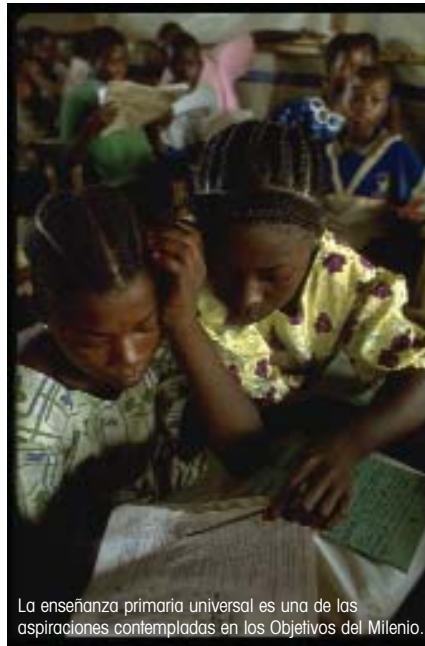
La enseñanza primaria universal es una de las aspiraciones contempladas en los Objetivos del Milenio.

Levántate es una iniciativa de movilización de la Campaña del Milenio "Sin excusas 2015". Sus objetivos son conseguir que el mayor número posible de personas en todo el mundo se ponga en pie el día 16 de octubre a las 12 de la mañana. El hecho de elegir el día 16 se debe a que el 17 de octubre se celebra el Día Internacional para la Erradicación de la Pobreza.