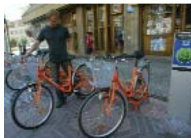
La iniciativa de Sevilla ha sido reconocida con el premio en la categoría de Energía.