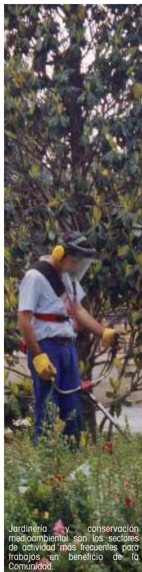
Jardinería y conservación medioambiental son los sectores de actividad más frecuentes para trabajos en beneficio de la Comunidad.

Los sectores de actividad ofertados por los Ayuntamientos adheridos al convenio son principalmente dos, el de jardinería y conservación medioambiental y el de limpieza y mantenimiento de las instalaciones municipales