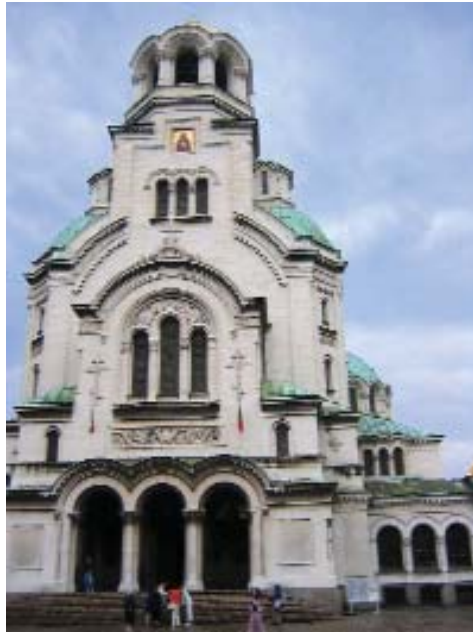
Catedral Patriarcal Alexander Nevsky, en Sofía, ciudad anfitriona de la reunión del CMRE.

Asimismo, se ratificará la Declaración Final de la XXIII Asamblea General de la organización, celebrada en Innsbruck (Austria) la pasada primavera, y se decidirá qué ciudad será la sede de la XXIV Asamblea General; las candidatas son Derby (Reino Unido), Malmö (Suecia) y Grönningen (Países Bajos). También está previsto analizar los resultados de la Conferencia de Lisboa sobre los Objetivos del Milenio (que se celebra los días 12 y 13 de este mes) y preparar el trabajo para la Reunión de Ciudades y Gobiernos Locales Unidos, CGLU (en Marrakech, el 30 de octubre y el 1 de noviembre) y la primera reunión para asuntos municipales del CMRE (en Stuttgart, a finales de noviembre)