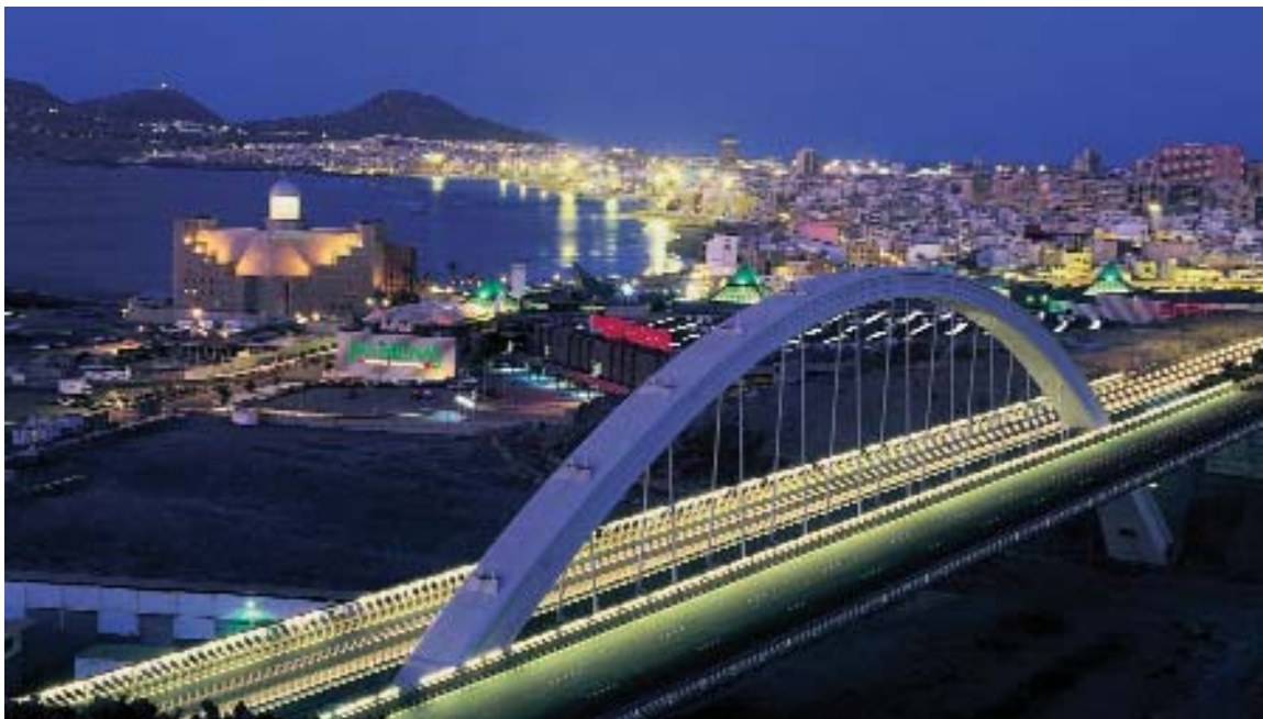
Las Palmas de Gran Canaria compartirá con Santa Cruz de Tenerife la capitalidad de Archipiélago.