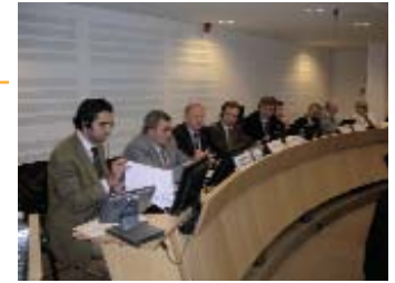
El Presidente de la Diputación de Badajoz, segundo por la izquierda, durante su intervención.