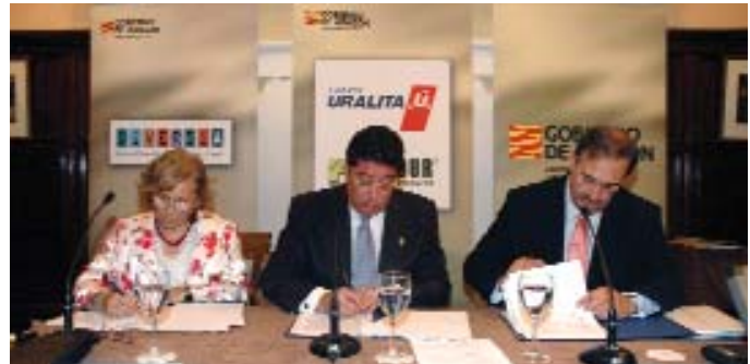
La Alcaldesa de Gelsa, junto al representante de Uralita y el del Gobierno de Aragón, suscriben el acuerdo de colaboración.

La empresa ha valorado la ubicación estratégica de su futuro emplazamiento, óptimo desde el punto de vista de la distribución y desde el de la obtención de materias primas, ya que se enmarca en una zona rica en yeso de gran pureza.