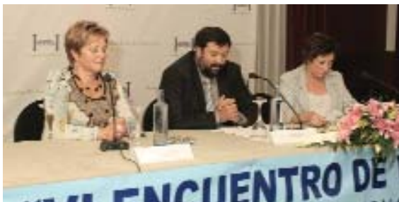
La Alcaldesa de Guitiriz, Regina Polín; el Secretario de Estado de Relaciones con las Cortes, Francisco Caamaño; y la Presidenta de la Sección de Villas Termales, Montserrat Domenech.

Finalmente, la representación de la FEMP explicó que avanza la vieja aspiración de que los Presupuestos Generales del Estado incluyan una partida económica para la elaboración de un plan de promoción del turismo termal en España.