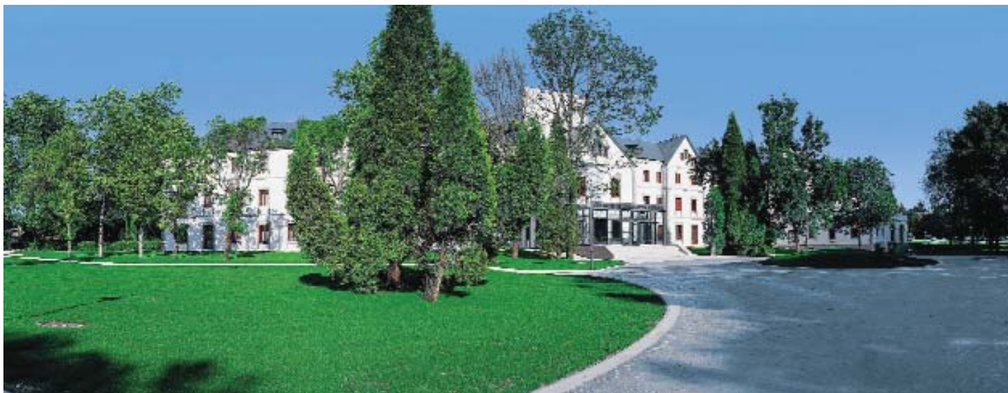
Balneario de Guitiriz, villa anfitriona del encuentro.

A lo largo de los últimos años, el turismo termal se ha desarrollado hasta el punto de convertirse en una de las más sólidas bases económicas de los municipios en los que está implantado; por ello, los representantes de esos municipios apostaron por crear una imagen de marca común que permita identificar su oferta termal y permita impulsar la actividad turística en sus términos. Así se propuso a mediados del pasado mes de septiembre en el Balneario de Guitiriz (Lugo), en el transcurso del VI Encuentro de Villas Termales de España, organizado por la Sección de Municipios con Aguas Minerales y Termales de la FEMP, de la que forman parte casi un centenar de municipios españoles.