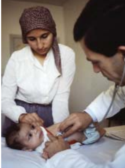
La reducción de la mortalidad infantil es el cuarto Objetivo.

En esta misma línea, la Declaración Final emitida tras la 23 Asamblea del Consejo de Municipios y Regiones de Europa (CMRE), celebrada en Innsbruck el pasado mes de mayo, señalaba textualmente que: “Manifestamos nuestro apoyo a la acción llevada a cabo por los Entes Locales y Regionales europeos a favor de los Objetivos del Milenio para el Desarrollo. Estos Objetivos representan el compromiso más claro y más universal de la comunidad internacional de los Estados para hacer frente a la pobreza, la exclusión social y a la precariedad que sufren centenares de millones de seres humanos. Los Objetivos del Milenio no pueden conseguirse sin la participación activa y el compromiso de los Entes Locales de todo el mundo, tal como lo ha reconocido Kofi Annan, Secretario de Naciones Unidas, en su reunión con la delegación de CGLU en septiembre de 2005. Nos alegramos, por tanto, del papel del CMRE y la CGLU en su labor de promoción y apoyo a los Objetivos del Milenio por parte de los Entes